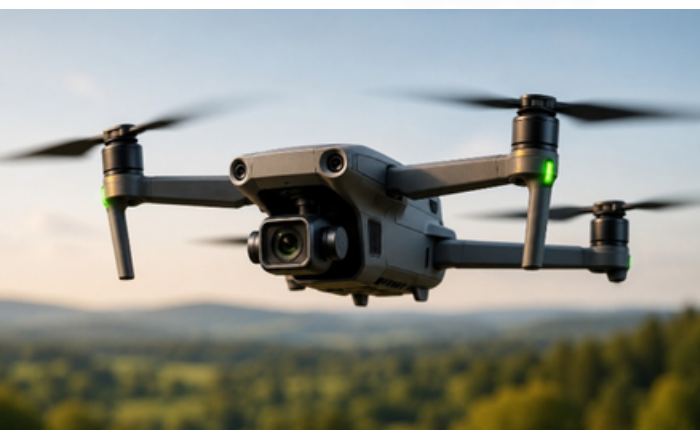
Pouze ilustrační fotografie.

Těší nás, že podpořené projekty nezůstávají pouze „na papíře“, ale jsou aktivně realizovány a přinášejí konkrétní přínosy do praxe.